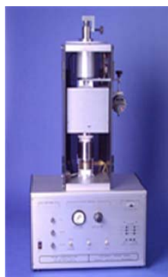
Guarded Heat FlowMeter