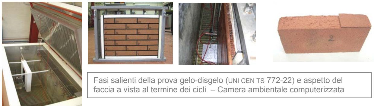
Fasi salienti della prova gelo-disgelo (UNI CEN TS 772-22) e aspetto del faccia a vista al termine dei cicli – Camera ambientale computerizzata